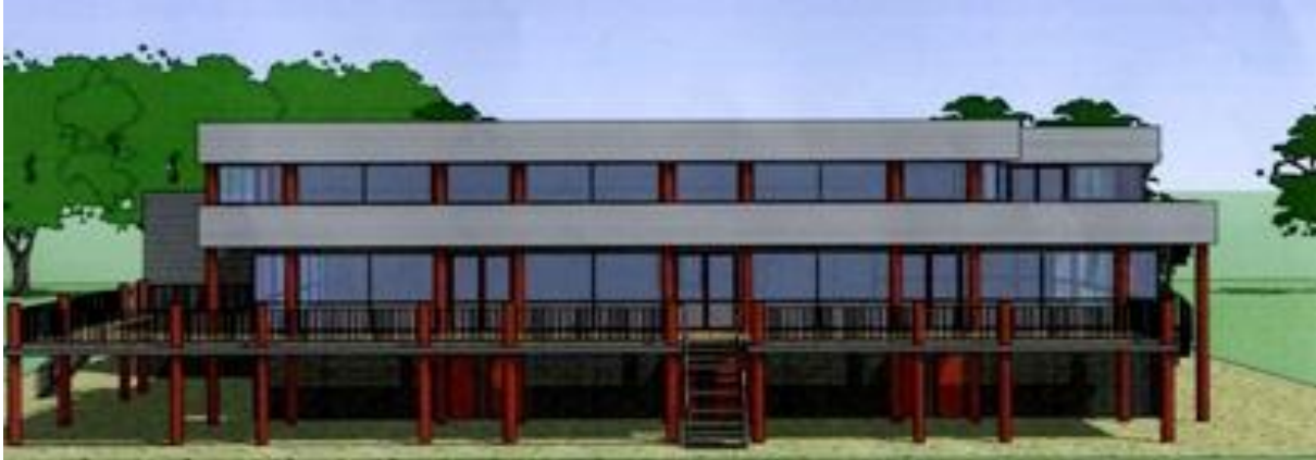
Artist impression AMVJ Sportcentrum 1

Nadat zij het prachtig gelegen sportcomplex aan de Jan Tooroplaan in het Amsterdamse Bos moesten verlaten, betrokken zij daar, in het Amstelveense polderlandschap, een nieuwe accommodatie, verenigd in de stichting AMVJ BuitenSportCentrum die tegenwoordig onder de naam AMVJ Sportcentrum nog altijd als beheerder en exploitant optreedt.