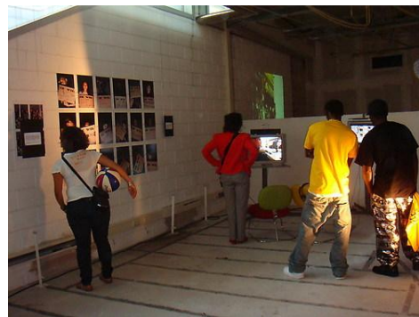
Project Summerjam 2008

Het AMVJ Fonds financiert nu sociaal-culturele projecten voor jongeren in Amsterdam, met de nadruk op die jongeren voor wie de toegang tot sociaal-culturele activiteiten moeilijk of niet vanzelfsprekend is. Het AMVJ Fonds is zich ervan bewust dat de Amsterdamse bevolkingssamenstelling met de jaren danig is veranderd. Projecten die de ontmoeting en culturele uitwisseling tussen jongeren bevorderen en bijdragen aan hun ontplooiing en participatie hebben dan ook prioriteit. Hierbij tracht het AMVJ Fonds zoveel mogelijk bij te dragen aan innovatie en ontwikkeling op het gebied van jeugd- en jongerenwerk en wordt vooral de ondersteuning van experimentele projecten met onderscheidend en innovatief vermogen tot haar kernactiviteiten gerekend. Zij ziet een blijvende rol voor zich weggelegd als stimulator van vernieuwende, resultaatgerichte en liefst ook duurzame projecten in Amsterdam. Het AMVJ Fonds typeert haar projecten dan ook als ‘ maatschappelijk investeren ’.