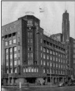
Het Centraal Gebouw ca. 1937

Vanaf 1919 werd het plan van een Centraal Gebouw serieus ter hand genomen. Het werven van zo'n 800.000 gulden aan kapitaal was nodig om de gemeente zover te krijgen garant te staan voor een hypotheek van nog eens 900.000 gulden. In 1926 werden de gezamenlijke